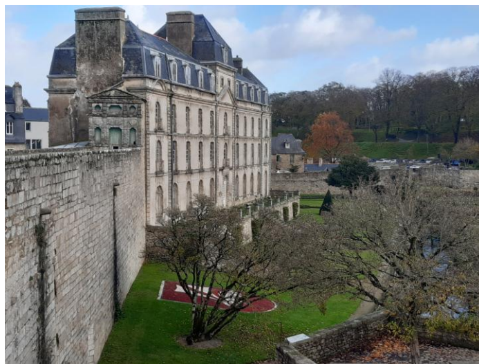
Vue de l’hôtel de Lagorce depuis les remparts

Le lieu choisi pour l’implantation du nouveau musée est l’hôtel de Lagorce implanté sur l’emplacement de l’ancien château de l’Hermine construit à la fin du XIVème siècle dont il ne reste que peu d’éléments en dehors des fondations. Le château de Lagorce a été édifié à la fin du XVIIIème siècle pour y établir un hôtel-restaurant qui ferma ses portes en 1803. Il fut racheté par l’État en 1876 et fit fonction successivement d’école d’artillerie, de siège de la Trésorerie générale du Morbihan puis d’école de droit. Il a été racheté par la ville de Vannes en 1976.