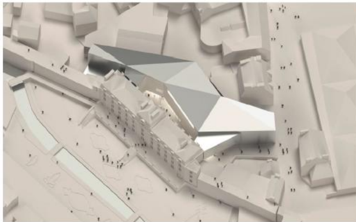
Photo de la maquette du projet retenu.

Le projet retenu se traduit par la construction d'un nouveau volume en aluminium recyclé à l'arrière du château de l'hôtel Lagorce lui-même réhabilité pour répondre aux exigences muséales d'aujourd'hui. L'entrée principale s'effectuera par l'avant de la façade principale du château de l'Hermine (côté jardins). Un accès secondaire est prévu Porte Poterne. La hauteur du bâtiment côté Porte Poterne n'excèdera pas 16 mètres.